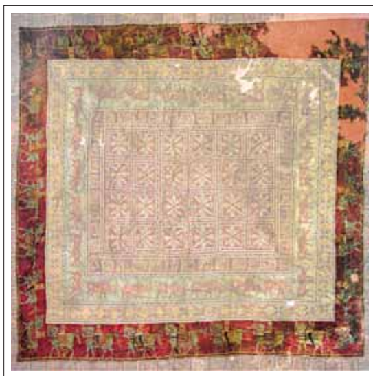
تصویر ۶: اسب سواران در لایه پنجم.

فرشی که به عنوان زین بر پشت اسبان طراحی شده‌اند، همگی در اختیار داشتن و اهلی بودن اسبان را نزد سواران آنها تأکید می‌کند. (تصویر ۶)