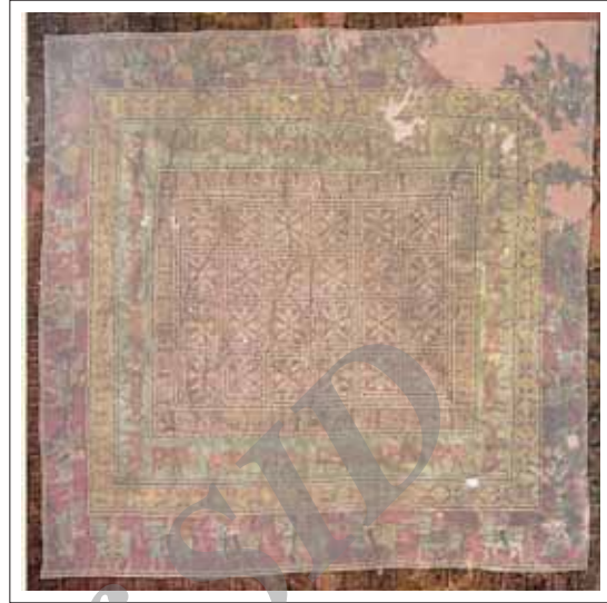
تصویر ۷: شیر دال در لایه ششم.

در لایه ششم بیش متن نیز همانند لایه دوم نقش جانور افسانه ای شیر-دال درون کادر مربع شکل طراحی شده است. تعداد این شیر-دال ها در این لایه ۸۱ عدد می باشد. (تصویر ۷)