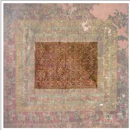
تصویر ۲: گل های هشت پر در لایه اول

«نقش گل های هشت پر ساده و یک رنگ از دوران تمدن سکایی و ماد و هزاره دوم پیش از میلاد در ایران وجود داشته است» (پرهام، ۱۳۷۰، ۱۰۴). اما هنرمند طراح قالی پازیریک در فرایند افزایشی دست به خود آرایشی زده، نقش مایه های هشت پر را با گلبرگ های یک در میان سیاه و سفید یا به رنگ های روشن و تیره نقش کرده است. در این فرایند، اضافه شدن جزئیات تزئینی مانند کادرهای مربع شکل با حاشیه ای از اشکال شطرنجی قابل تأمل است. بر اساس مطالعات انجام شده همگی اقسام نگارگری شطرنجی یک درمیان سیاه و سفید نشانه تالو و از نمادهای آب می باشد. (افروغ، ۱۳۸۹، ۱۷۷)