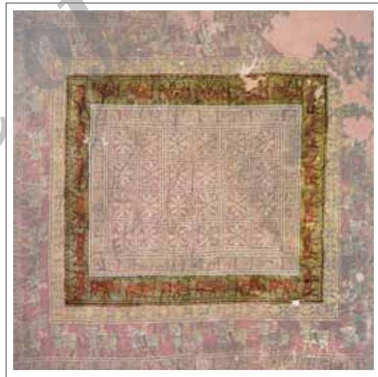
تصویر ۴: گوزن شاخ پهن در لایه سوم.

در سومین لایه در بیش متن ۲۴ گوزن‌های زرد شاخ پهن ایرانی در حال چرا نقش شده‌اند. (تصویر ۴)