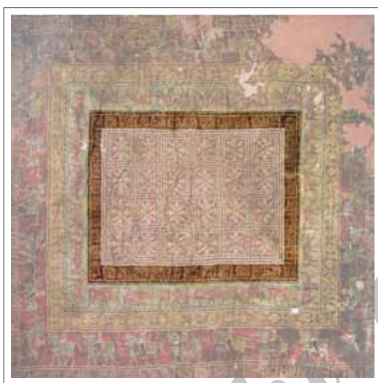
تصویر ۳: شیر دال در لایه دوم.

در دومین لایه در بیش متن ۴۲ شیر دال ۱۹ درون کادر مربع شکل با یک نوار شطرنجی محاصره شده است که بر اساس آنچه گذشت نمادی از تالو آب هستند. (تصویر ۳)