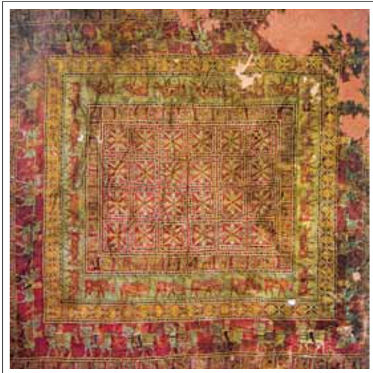
تصویر ۱: قالی پازیریک

طرح این فرش از دو بخش مجزای زمینه و حاشیه تشکیل شده است که به اصطلاح آن را لایه می‌نامیم. زمینه فرش یا لایه اول تعداد ۲۴ مربع می‌باشد که داخل هر یک گل‌هشت پر تصویرسازی شده است. در دومین لایه ۴۲ تصویر حیوانی افسانه‌ای شبیه به یک شیر بالدار قرار دارد که در اصطلاح به شیر دال شهرت یافته است. در لایه سوم ۲۴ گوزن زرد خال دار در حال چریدن تصویر شده است. در لایه چهارم ۶۲ عدد گل‌های چهار پر شبیه به گل‌های هشت پر لایه اول تصویرسازی شده است که نقش آنها اندکی دگرگون شده و بدون قاب می‌باشند. لایه پنجم ۲۸ تصویر از اسب سوارانی است که به‌طور دو نفر در میان به تناوب بر روی اسب‌ها نشسته و یا ایستاده‌اند. لایه ششم فرش شامل همان شیرهای بالدار قبلی است که در لایه دوم تصویرسازی شده‌اند. ولی تا حدی بزرگ‌تر از آنها و در جهت مخالف آنها نقش شده‌اند و تعداد آنها ۸۱ عدد می‌باشند. ۱۴ همه پنج حاشیه را آدین‌هایی شطرنجی شکل که شبیه پیرامون زمینه مرکزی‌اند، احاطه کرده‌اند.